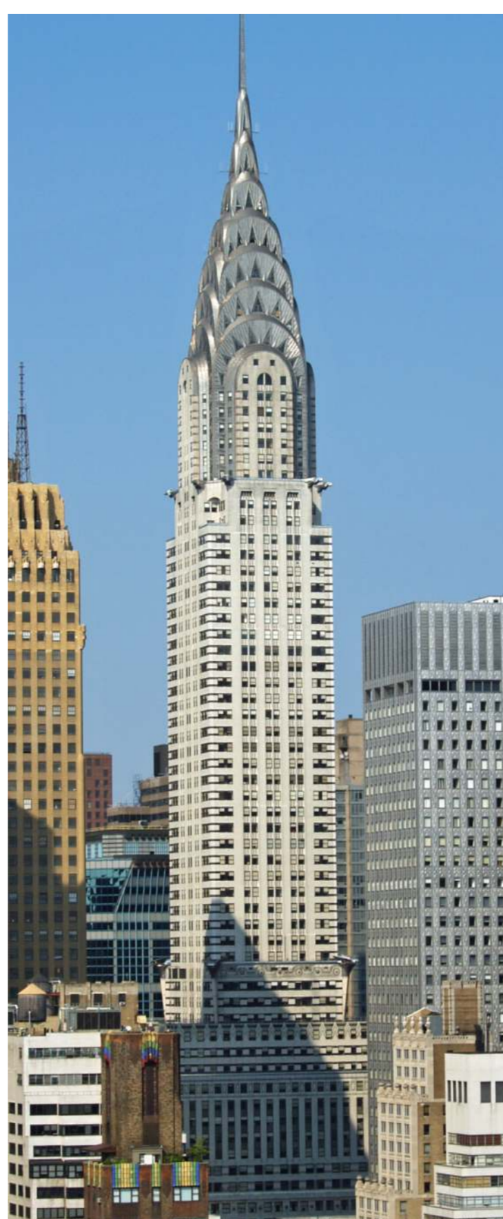
New York (USA), Chrysler Tower, William Van Alen, 1929-1930