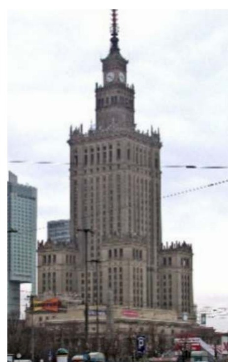
Varšava (Polsko), Palác vědy a kultury, Lev Vladimirovič Rudněv 1952-1956