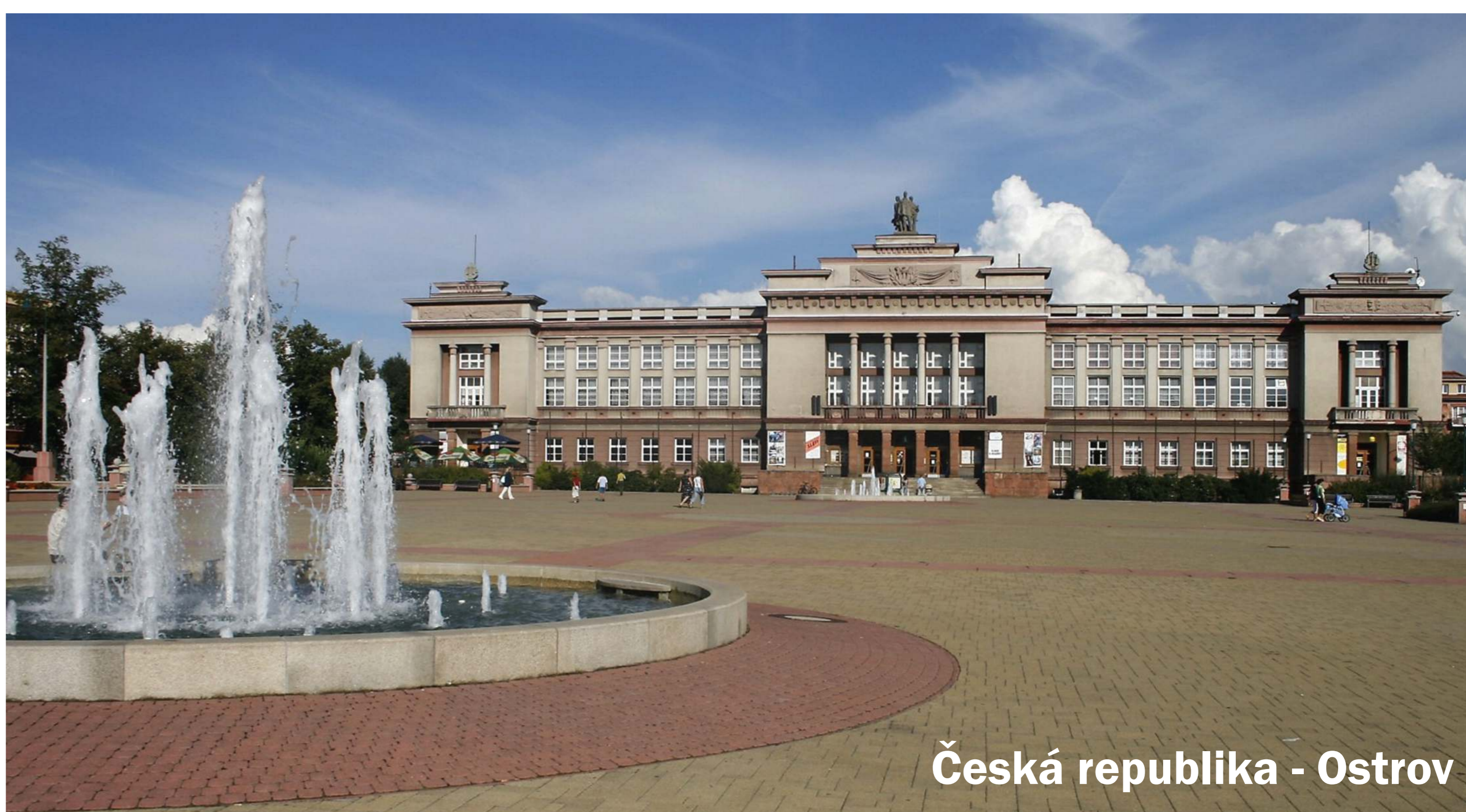
Česká republika - Ostrov