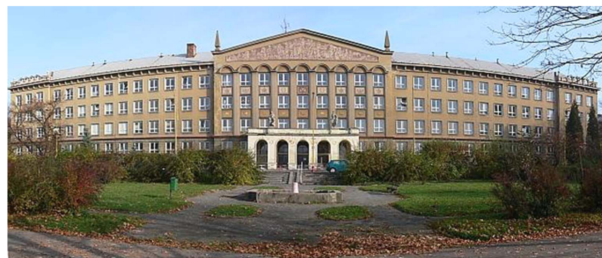
Havířov (Česká republika)