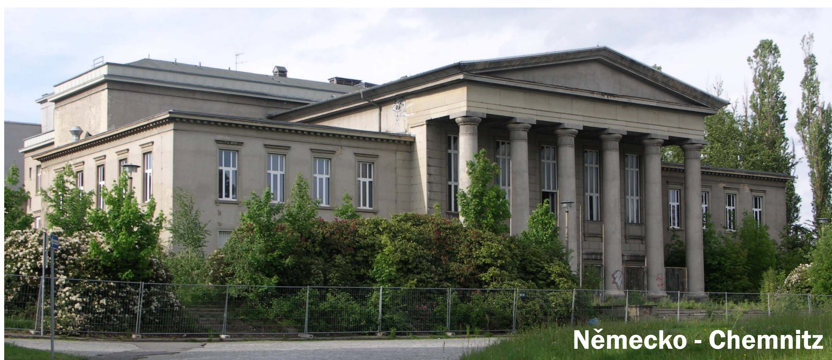
Německo - Chemnitz