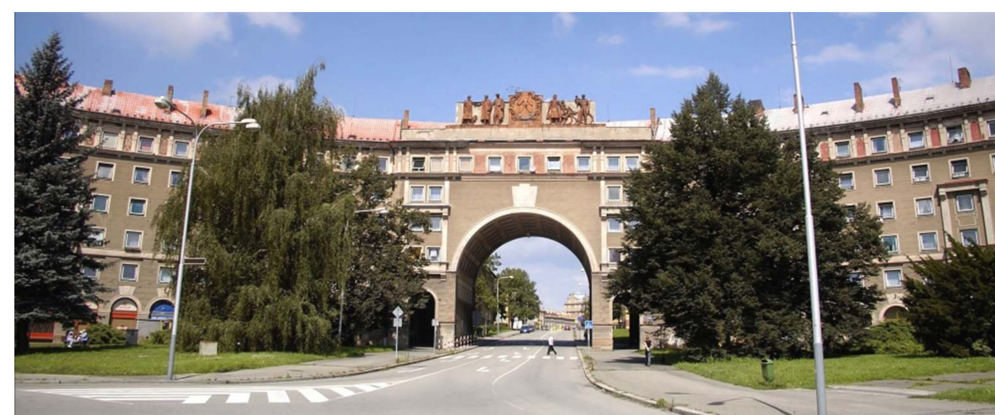
Ostrava Poruba (Česká republika), tzv. Oblouk